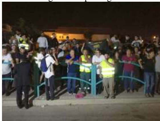
Demonstratie voor het woonhuis.

De laatste tijd is het wat stiller wat betreft de demonstraties. Maar in de krant werd er gezegd, dat de afgelopen demonstraties een voorbereiding waren op wat groters.