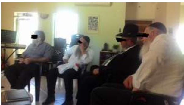
Deel van het "Sanhedrin"

Aan het eind van de zitting waren we overeengekomen dat we (voorlopig) het inloophuis zouden sluiten, en dat we samen met de "religieuze leiders" verder zouden praten over hoe het inloophuis een plek zou kunnen krijgen in de gemeenschap. De ogen vol haat voorspelden echter niet veel goeds.