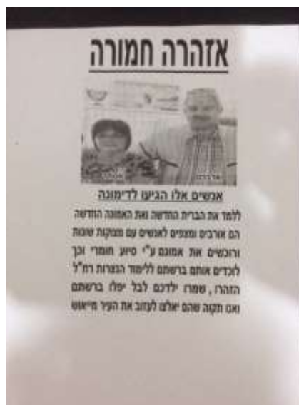
Flyer met als opschrift: Ernstige waarschuwing

Omdat ze ons niet kunnen "aanklagen" en niets kunnen vinden, wordt een ander wapen ingezet: leugens, laster en verdraaiing van feiten. Er verschijnen foto's van ons in het centrum met ernstige waarschuwingen. Ook worden er op billboards grote aanplakbiljetten opgehangen met lelijke teksten.