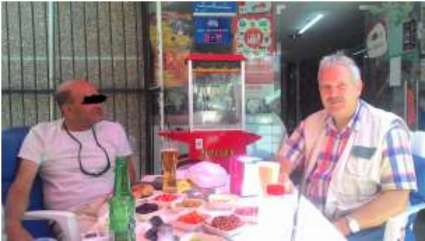
Inloophuis dicht.....terras open