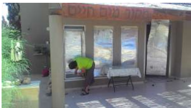
Afplakken ramen voor de stenen

Onze plannen voor ons verlof hebben we gezien de hele situatie dit keer aan moeten passen. We hopen eerst eind juni, begin juli met vakantie naar de bergen te gaan. Vrienden in Israël hebben ervoor gezorgd dat we 2 weken gratis verblijf hebben in Oostenrijk. Ook het geld voor de tickets hebben ze geregeld! Het is goed om even 'afstand' te kunnen nemen en in een andere omgeving te zijn. We mogen zien dat God in alles voorziet op de juiste tijd! Hem zij de dank! Gewoonlijk komen we al in juli naar Nederland. Maar nu zal dat waarschijnlijk (afhankelijk van de situatie op dat moment) pas augustus worden. Hierdoor heb ik ook mijn (s)preekbeurten in juli terug moeten geven.