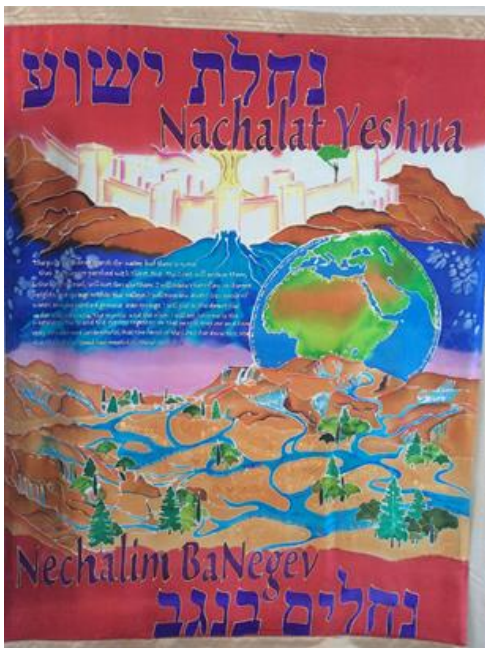
Banier zoals afgebeeld in de gemeente van Beersheva.

Toen wij in 2008 werden uitgezonden was o.a. één van onze taken "Messiaanse gemeenten" ondersteunen in hun verantwoordelijkheid om de "verloren schapen" van het huis van Israël in aanraking te brengen met de blijde boodschap. Sinds 2010 mochten we in Dimona starten. Vanaf die tijd zijn we ook verbonden aan de Hebreeuws sprekende gemeente "Nachalat Yeshua" in Beersheva. "Nachalat Yeshua" betekent "Erfdeel van Jezus" Hij is ons Erfdeel, en wij zijn Zijn Erfdeel.